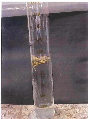
Bild 1. Det uppsamlade materialet ur 0/32K som utgjordes av träflis volymbestäms.

Uppdraget bestod i att bestämma träflisinhållet i en krossprodukt 0/32K. Metodiken vi använde var att väga materialet och bestämma totalvikt prov (torrvikt) genom att bestämma fukthalten i provet och räkna bort vattnet. Materialet dränktes sen i vatten och det materialet som flöt upp insamlades och bestämdes i ett mätglas som volym träflismaterial i \text{cm}^3 .